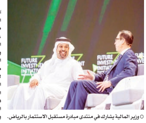
وزير المالية يشارك في منتدى مبادرة مستقبل الاستثمار بالرياض.