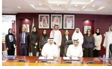
○ خلال توقيع مذكرة التفاهم.

في مبادرة تستهدف تعزيز جهود البحث العلمي والابتكار، وقع مركز البحرين للدراسات الاستراتيجية والنوعية والمطابقة، و«غرفة تجارة وصناعة البحرين» صباح أمس مذكرة تفاهم في مجال البحوث والدراسات على مستوى المملكة البحرين.