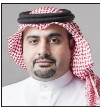
الشيخ ناصر بن محمد