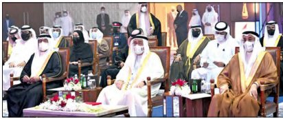
محمد بن مبارك خلال حفل جائزة التميز الحكومية الإلكتروني

أكد سمو الشيخ محمد بن مبارك آل خليفة نائب رئيس مجلس الوزراء، رئيس اللجنة العليا لتقنية المعلومات والاتصالات، أن جائزة التميز للحكومة الإلكترونية إحدى أهم المبادرات الوطنية التي تأتي في إطار رؤية عامر البلاد، ومتابعة ولي العهد رئيس مجلس الوزراء، بتبني التقنيات الحديثة واستثمار التكنولوجيا في مختلف المجالات، وتسريع وتيرة التحول الرقمي في الجهات الحكومية. وقال سموه، خلال رعايته حفل جائزة التميز للحكومة الإلكترونية أمس: «لقد أثمرت هذه الرؤية بناء قطاع قوي وتحقيق مكانة عالمية متقدمة في مجال تكنولوجيا المعلومات والاتصالات».