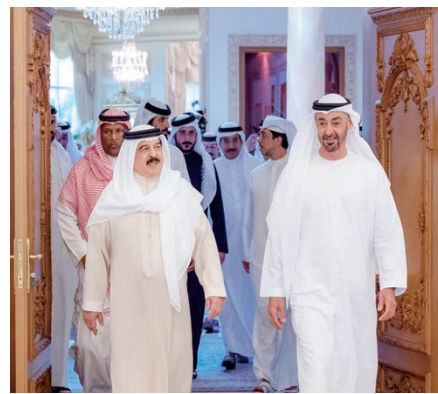
جلالة الملك خلال لقائه سمو الشيخ محمد بن زايد.

أشاد حضرة صاحب الجلالة الملك حمد بن عيسى آل خليفة ملك البلاد المفدى بما حققته دولة الإمارات العربية المتحدة من إنجازات حضارية وتنموية واقتصادية وثقافية وعلمية رائدة، وبدورها المحوري الفاعل على الصعيدين الإقليمي والدولي ومساعيها الخيرة في ترسيخ مقومات الأمن والاستقرار ونشر السلام في المنطقة والعالم، ومبادراتها العالمية المقتردة في ميد الخير والعون لخدمة الإنسانية وترسيخ قيم التعايش والتسامح والتعاون بين الشعوب.