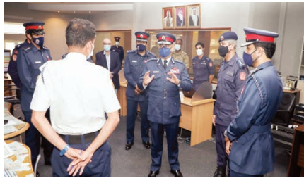
○ الفريق طارق الحسن خلال تفقده الفريق.

تترأس الفريق الركن ذياب بن صفر العمير رئيس هيئة الأركان صباح أمس أعمال اجتماع اللجنة العسكرية العليا لـ ١٨ لرؤساء أركان القوات المسلحة بدول مجلس التعاون لدول الخليج العربية، وذلك عبر تقنية الاتصال المرئي. وحضر الاجتماع اللواء الركن الشيخ عبد الله بن راشد آل خليفة مساعد رئيس هيئة الأركان للقوة الشريفة، واللواء الركن غانم إبراهيم الفضالة مساعد رئيس هيئة الأركان للعمليات، وعدد من كبار ضباط دفاع البحرين.