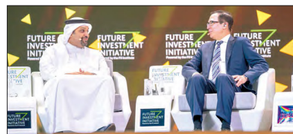
وزير المالية خلال مشاركته في منتدى مستقبل الاستثمار

أكد الشيخ سلمان بن خليفة آل خليفة وزير المالية والاقتصاد الوطني أن النمو الاقتصادي عملية مستمرة تتطلب تعزيز التنافسية، عبر تطوير السياسات والتشريعات الداعمة للانفتاح والنمو. وأشار وزير المالية والاقتصاد الوطني، خلال مشاركته في الجلسة النقاشية العامة في منتدى مبادرة مستقبل الاستثمار، إلى أن هناك مؤشرات تدفع إلى التفاؤل بتحقيق معدلات نمو عالية في قطاعات التكنولوجيا، والتكنولوجيا المالية، والرعاية الصحية، والخدمات اللوجستية، وأوضح أن برنامج «التوازن المالي» نجح في تحفيز القطاعات غير النفطية.