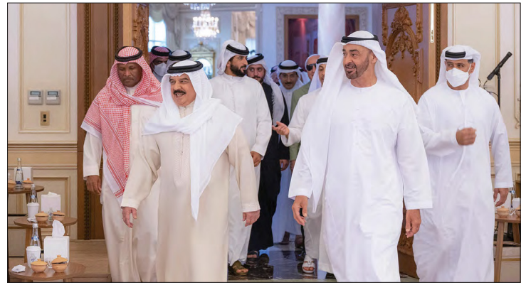
جلالة الملك يلتقي محمد بن زايد في الإمارات