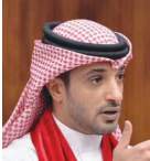
غاري أل رحمة

أشاد النائب غاري أل رحمة بالمشاركة الناجحة والمميزة لصاحب السمو الملكي الأمير سلمان بن حمد آل خليفة ولي العهد رئيس مجلس الوزراء، نيابة عن حضرة صاحب الجلالة الملك حمد بن عيسى آل خليفة عاهل البلاد المفدى، في منتدى مبادرة مستقبل الاستثمار في نسخته الخامسة الذي عقد في الرياض تحت رعاية من خادم الحرمين الشريفين الملك سلمان بن عبدالعزيز آل سعود عاهل المملكة العربية السعودية الشقيقة. وأشاد بالمباحثات الثمينة التي عقدها سموه مع أخيه صاحب السمو الملكي الأمير محمد بن سلمان بن عبدالعزيز آل سعود، ولي العهد نائب رئيس مجلس الوزراء وزير الدفاع بالمملكة العربية السعودية، وهي المباحثات التي أكدت العلاقات الراسخة التي تربط مملكة البحرين والمملكة العربية السعودية، والتي تشهد على الدوام نموًا يستند إلى إرث تاريخي من المحبة والأخوة والتراحم.