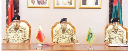
○ رئيس الأركان خلال ترؤسه الاجتماع.

وكذلك جهود صاحب السمو الملكي الأمير سلمان بن حمد آل خليفة ولي العهد رئيس مجلس الوزراء الذي يجسد الرؤية الاستراتيجية الوطنية في مجال التوضيح بالعمل التنموي الذي يركز على تطوير القطاعات الحيوية في ظل الظروف الاقتصادية المتغيرة، كما أصدرت عن استراتيجيات الأعمال التي تهدف إلى دعم وتسهيل الأعمال التجارية والاقتصادية، بالإضافة إلى توفير خدمات استشارية متخصصة في مجالات التخطيط الاستراتيجي، وإدارة الأعمال، والتسويق، والتمويل، والموارد البشرية، وغيرها من المجالات التي تهم المؤسسات الصغيرة والمتوسطة، وذلك بهدف تعزيز النمو الاقتصادي، وتحسين جودة الخدمات المقدمة، ودعم الاستثمارات الأجنبية، وتطوير المهارات البشرية، ورفع مستوى التعليم والبحث العلمي، وتعزيز التعاون بين القطاعين العام والخاص.