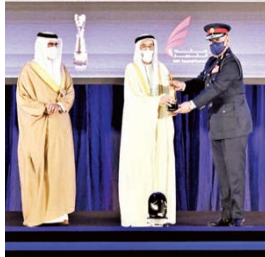
سمو الشيخ محمد بن مبارك خلال تسليم الجائزة.

قال سمو الشيخ محمد بن مبارك آل خليفة نائب رئيس مجلس الوزراء رئيس اللجنة العليا لتقنية المعلومات والاتصالات إن جائزة التميز للحكومة الإلكترونية إحدى أهم المبادرات الوطنية التي تأتي في إطار رؤية وتوجيهات حضرة صاحب الجلالة الملك حمد بن عيسى آل خليفة عاهل البلاد المفدى ومتابعة صاحب السمو الملكي الأمير سلمان بن حمد آل خليفة ولي العهد رئيس مجلس الوزراء بتبني التحولات الحديثة واستثمار التكنولوجيا، وتسريع وتيرة التحول الرقمي في الجهات الحكومية. جاء ذلك خلال رعاية سموه أمس حفل جائزة التميز للحكومة الإلكترونية ٢٠٢١.